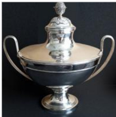
Große silberne Deckelterrine aus ehem. Besitz des preußischen Feldmarschalls Wilhelm Fürst von Ra...