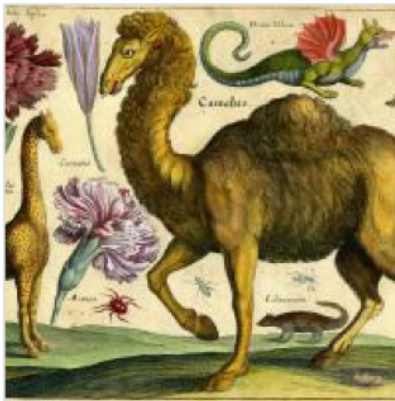
Naturstudie des Kupferstechers Wenzel Hollar (1607-1677), aus: Kamels aus „Neues Blumen, Frucht u...

Vom 19. bis 27. Oktober lockten Kunst- und Kunsthandwerk zahlreiche Sammler und Liebhaber an die Isar, auf den Nockherberg in München. Diese traditionsreiche Kunst- und Antiquitätenmesse wurde im Jahr 1969 gegründet und wird 2 x jährlich im Festsaal am Nockherberg veranstaltet. Hier findet der Besucher nicht nur "Regionale Stücke" und "Alpenländische Kunst", sondern auch "Internationale Kunstwerke" und "Kunsthandwerk" aus allen Epochen - von der Zeit der Gotik über Barock und Biedermeier bis zum Art Déco. Auch die Klassische Moderne ist vertreten. Eine Jury aus Fachleuten begutachtet für das geschätzte Publikum vor jedem Messe-Start die Qualität und Originalität.